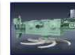
Máq. Desc. Rotativa