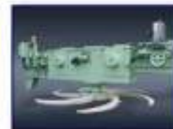
Máq. Desc. Rotativa