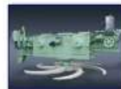
Máq. Desc. Rotativa