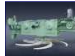
Máq. Desc. Rotativa