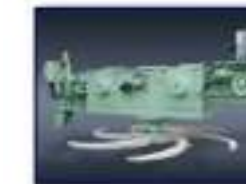
Máq. Desc. Rotativa