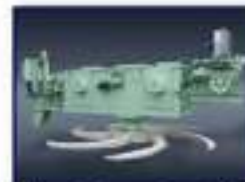
Máq. Desc. Rotativa