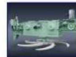
Máq. Desc. Rotativa