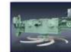
Máq. Desc. Rotativa