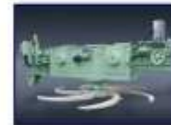
Máq. Desc. Rotativa